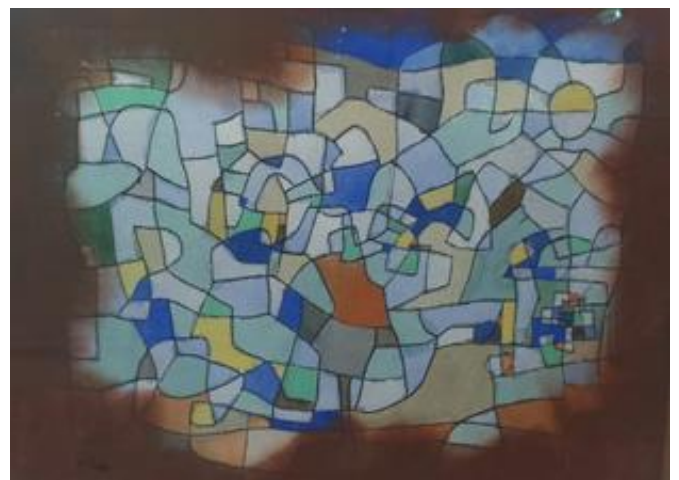
Apicoltore all'opera – P.K.

Segnaliamo che è possibile continuare a donare attraverso il sito con paypal oppure tramite bonifico intestato ad APISFERO A.P.S: presso Banca Popolare Etica. IBAN: IT47N0359901899050188538029.