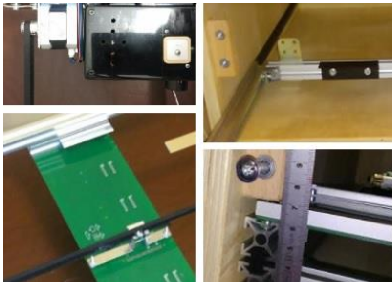
Frammenti operosi (Apisfero), inizi XXI secolo