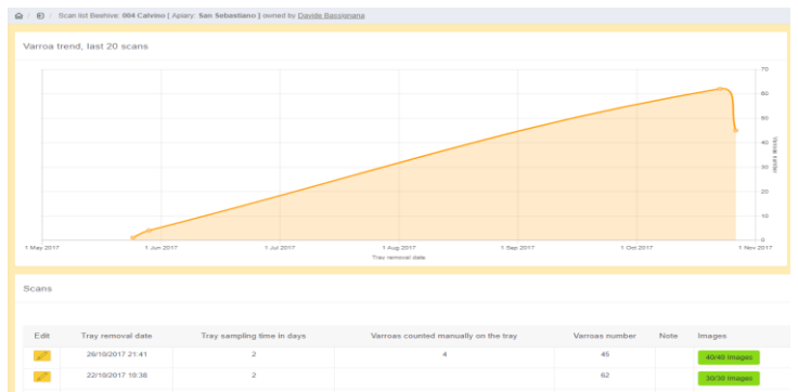
Figura 2 - Pagina in inglese dell'andamento della varroa per un alveare

La console di amministrazione www.apisferoweb.it è stata in questi giorni tradotta in lingua inglese, visto il respiro internazionale del nostro progetto. All'accesso dell'utente è possibile selezionare la lingua madre o quella inglese. Nelle prossime settimane diventerà multilingue anche il sito ufficiale www.apisfero.org .